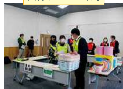
活動に必要な道具の貸出と現地までの交通ルートをお伝えします。