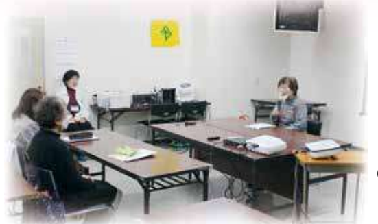
難聴者の体験談を聴かせていただきました。