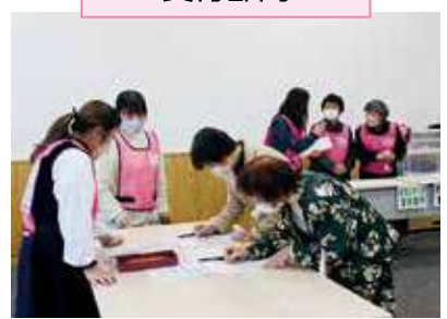
各地から来られたボランティアさんの受付を行います。