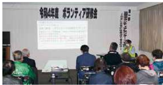
県社協の講師による、災害ボランティアセンターの講義

第2部では、ボランティアセンター開設運営の訓練を行いました。実際に災害が起こったと想定し、災害ボランティアセンターの立ち上げを行い、市ボランティア連絡協議会のみなさんにも運営スタッフとして体験をしていただきました。