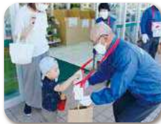
「スーパー もりかわ」