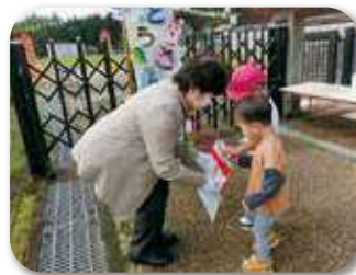
「室生こども園運動会」