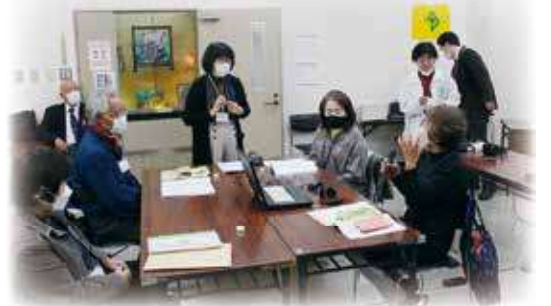
実際に耳の聞こえにくいことを体験し、その時にどんな気持ちだったかを学びました。