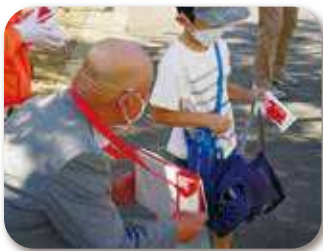
「菟田野小学校体育大会」