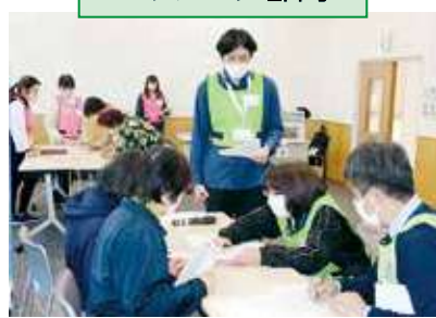
ボランティアさんに合った活動内容や場所を調整します。