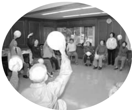
ゴムボールを使って体操をしました

その後、川上村の保健師から『介護疲れをしないために』と題して話があり、ゴムボールを使って腰痛・肩こり予防の体操もしました。帰りは、蜻蛉(せいらい)の滝へ紅葉狩りを計画していましたが、あいにくの雨で車中から紅葉を見ながら帰りました。