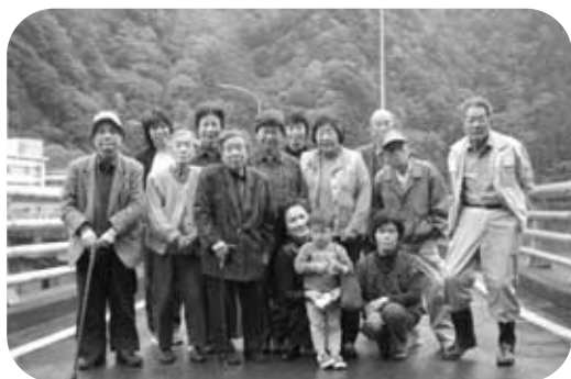
参加者のみなさん 川上村(大迫ダム)で