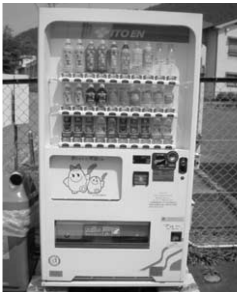
←【設置場所】 榛原区萩原 宇陀商工会館