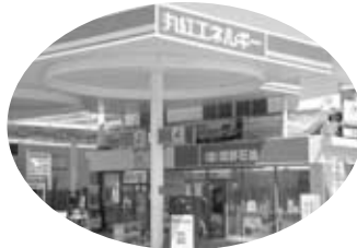
【設置場所】 → 大宇陀区春日 丸紅エネルギー ㈱岡野石油