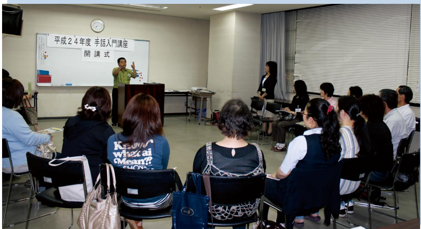
<開講の挨拶を聞いておられる受講生のみなさん>