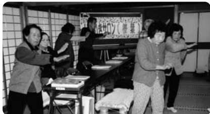
健康体操をしている様子