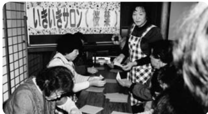
折紙でクリスマスリースを作っている様子