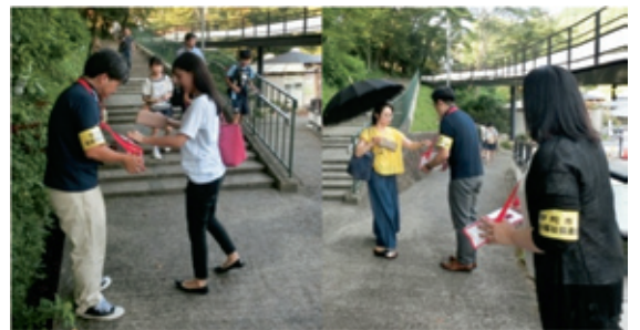
写真(上:室生口大野駅前)(下:榛原駅前)