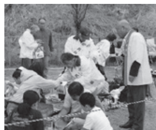
「菟田野小学校体育大会」