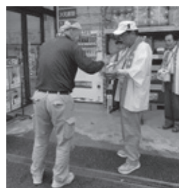
「コメリ大宇陀店前」