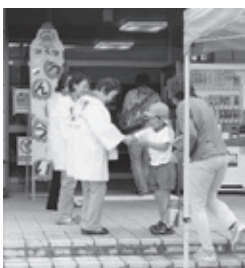
「室生こども園運動会」