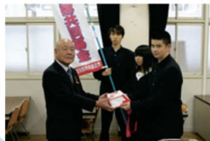
榛生昇陽高等学校