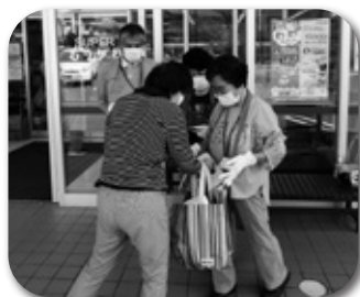
「スーパーもりかわ」