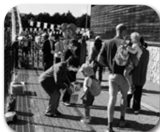
「室生こども園運動会」