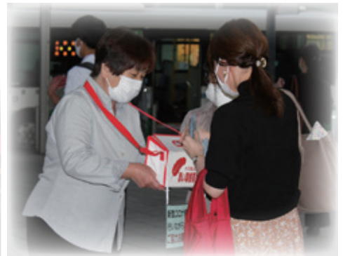
写真: 10/1 榛原駅前 募金活動の様子